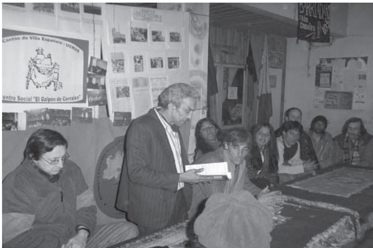
Inauguración del Cantón Villa Española de Ucrus, en setiembre de 2004

–Estaba lleno de ratas, fuimos limpiando porque había mucha mugre. Ahora estamos precisando chapas, palos, arena, portland, para tener las condiciones mínimas para