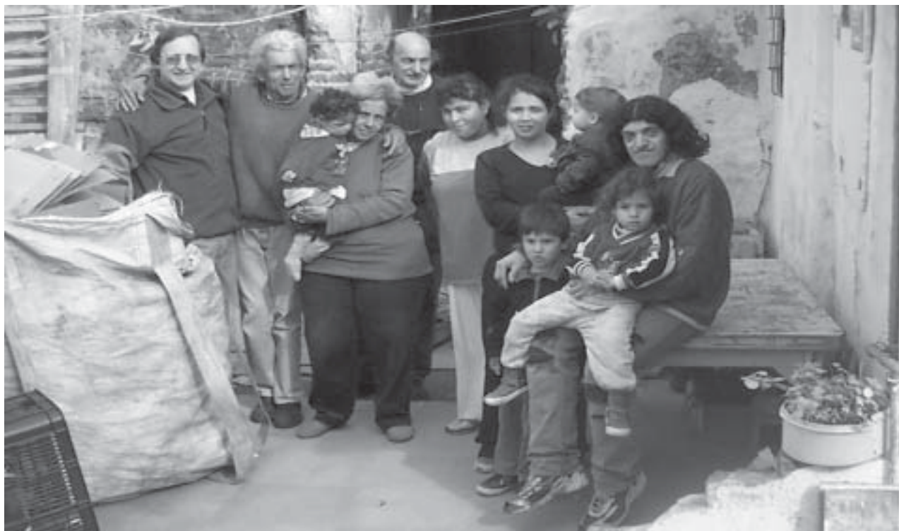
A la espera del apoyo del Plan de Emergencia Social

funcionar. Llegamos allí sin prácticamente nada.