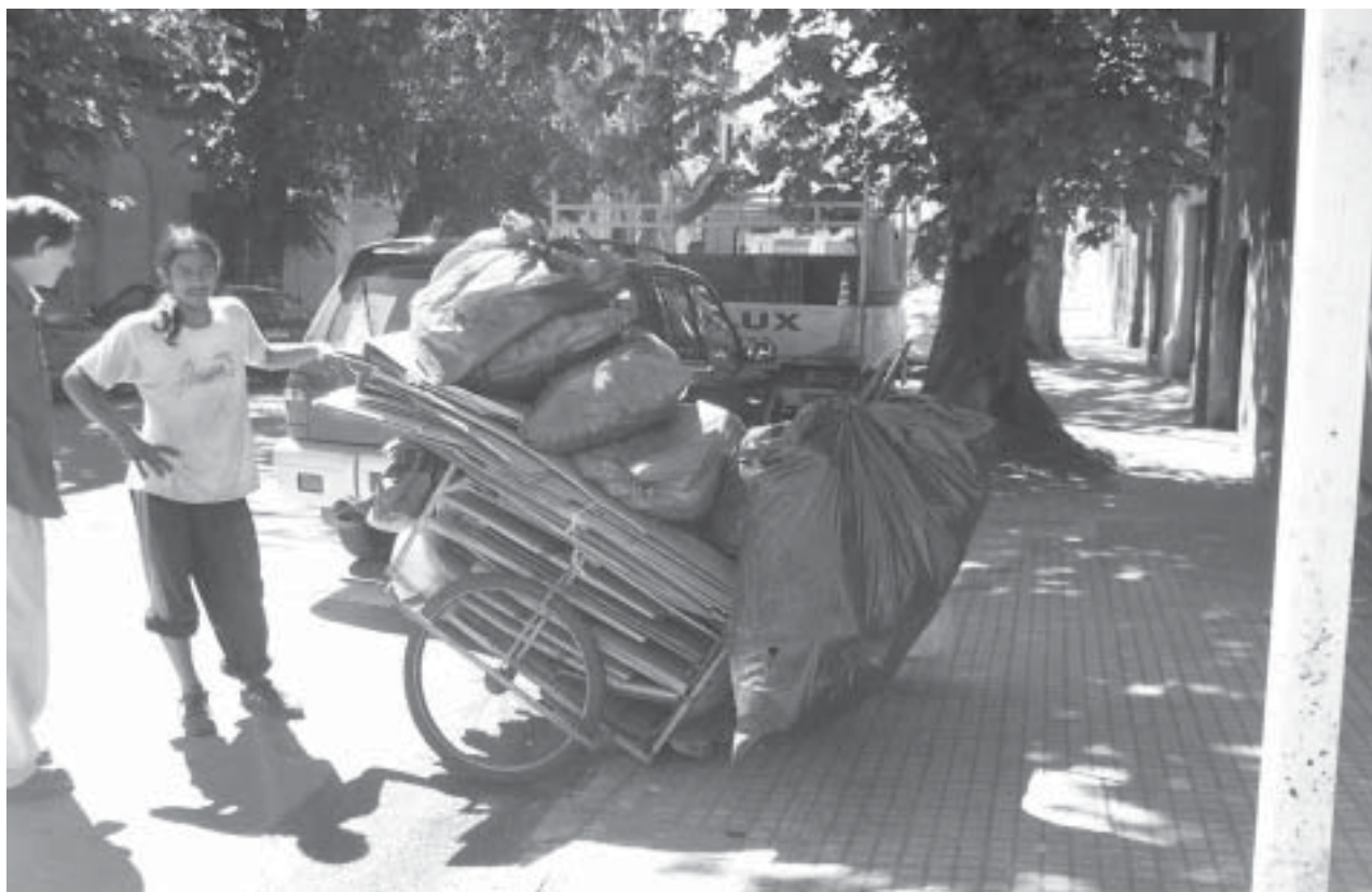
Papel y cartón al peso. Mucho bulto y poca plata

–Según la zona. No todos pagan igual. Pero yo no puedo ir si no tengo un carro con caballo hasta la otra punta de la ciudad, a vender a un mejor precio. En mi zona que es Villa Española al