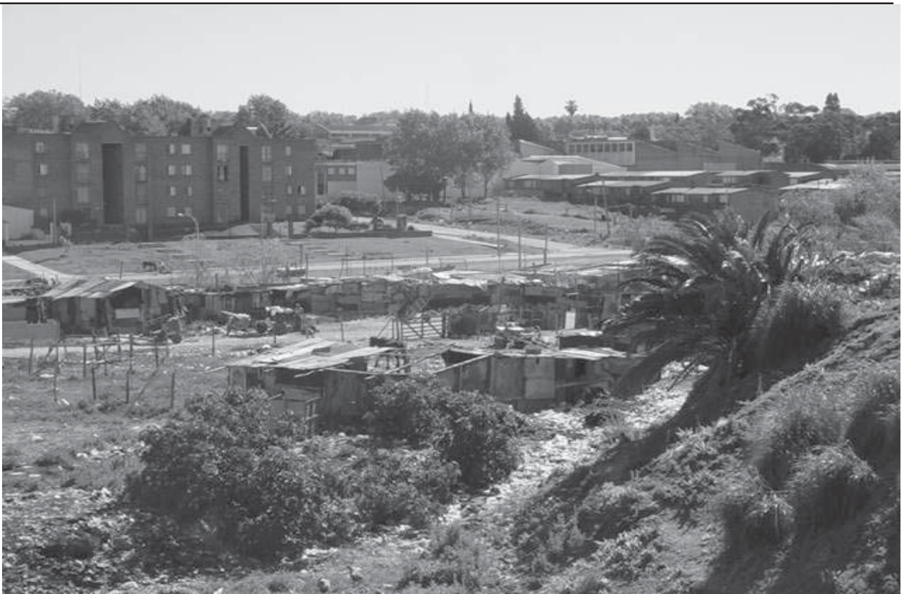
La "ex Cantera de los Presos", lugar donde durante años existió la "recuperación salvaje de residuos"

intermediarios muchas veces inescrupulosos.