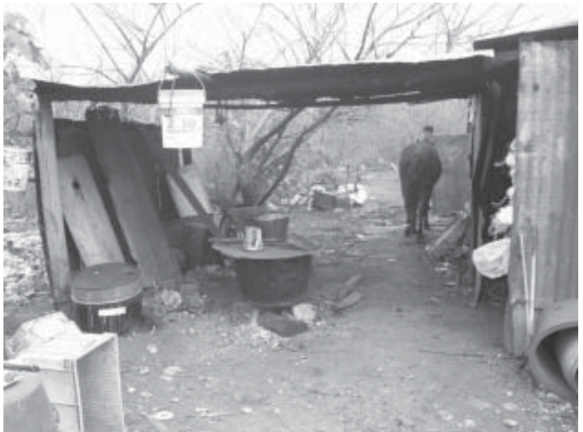
Un techo de lata hace de caballeriza

– Generalmente hay más de un perro alrededor de un hogar de clasificadores.