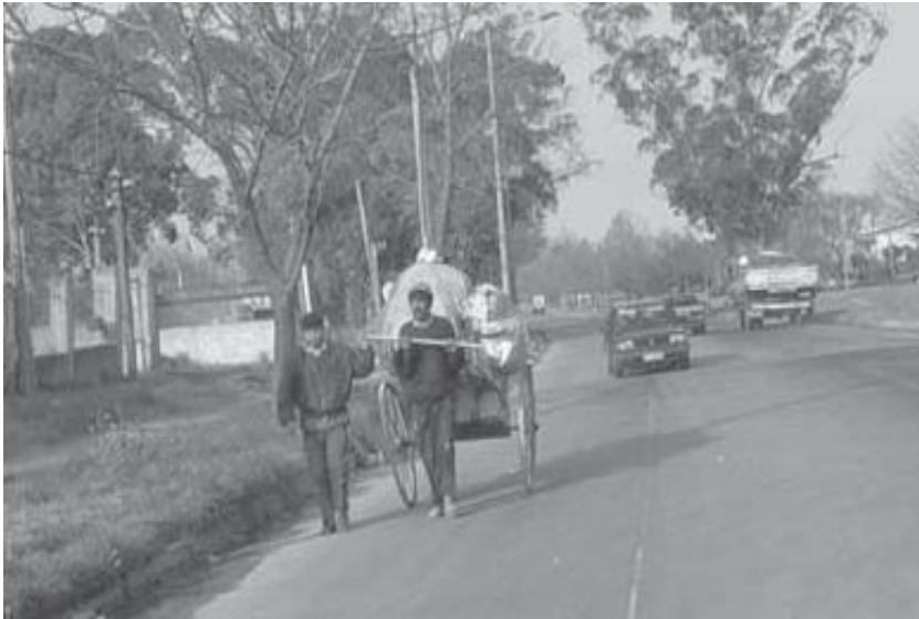
Carro de mano. Mucho caminar y poca carga

–Sí, porque cuesta trabajar en equipo. Al clasificador hay que educarlo para que trabaje en equipo. Ahí está la cosa.