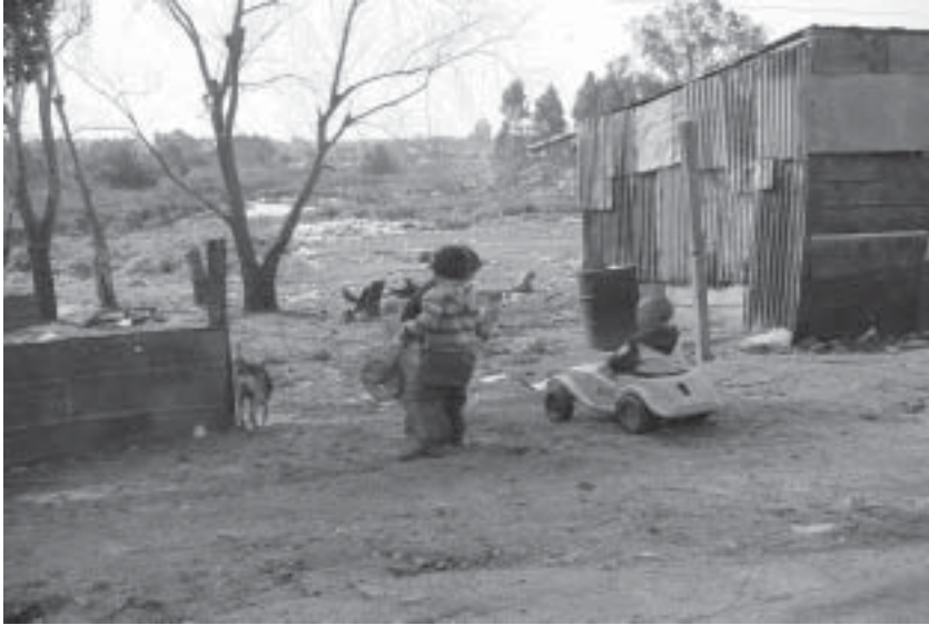
En los cantegriles no faltan juguetes, sí muchas otras cosas

aparte. Ahora algunos lo ponen colgado o al lado de los contenedores de esos nuevos que puso la intendencia.