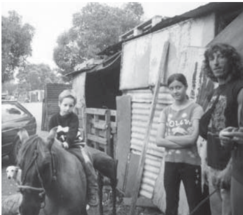
"Ranchos" de chapa y cartón. Es lo común en el sector

—No. A veces se va a un lugar solito y se muere sólo. Como aquel lobo viejo que se aparta de la manada en silencio y se muere. Porque la manada dice