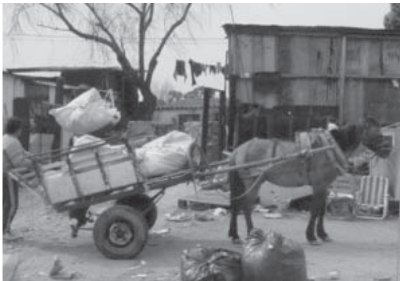
Carro a caballo con ruedas de auto

–Yo qué sé. Yo te digo lo que le decían los médicos. Pero antes en la calle se conseguía queso.