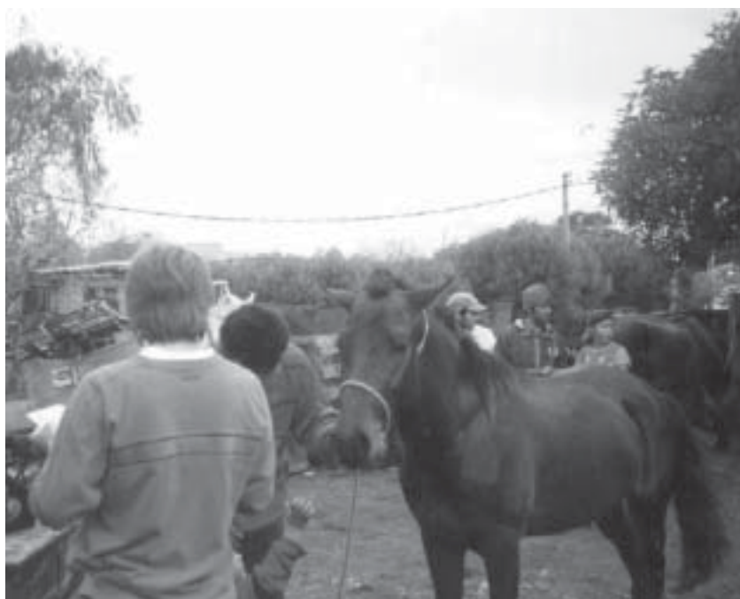
Campaña de vacunación de caballos en La Cantera del Zorro

–Sí. Con quienes más nos relacionamos es con los médicos de la Facultad de Veterinaria,