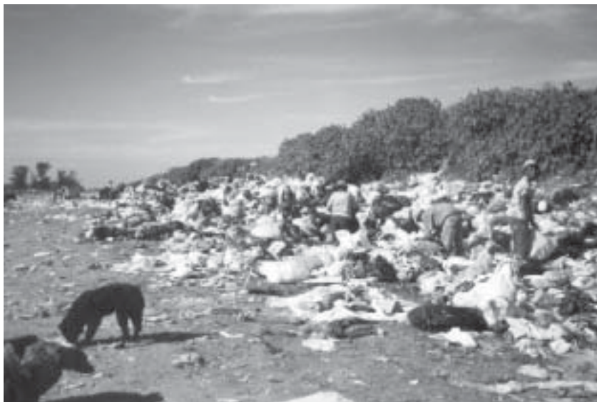
Clasificadores, cada uno recogiendo para sí

–Y venden al peso y allí surge el problema que tienen con las balanzas de estos